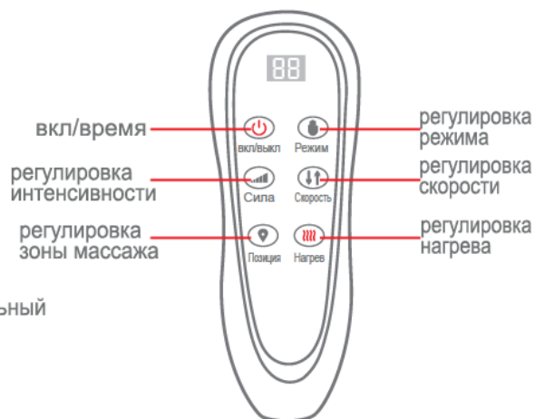
Контроллер массажного матраса