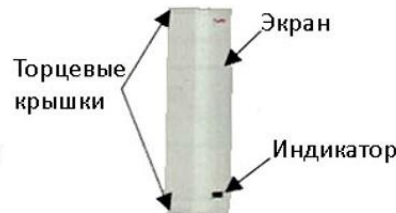
Рис. 2 - Основные элементы рециркулятора 1-115 М, 1-115 МТ, 1-130 М, 1-130 МТ, 2-115 М, 2-115 П, 2-115 МТ, 2-115 ПТ, 2-130 ПТ, 2-130 М, 2-130 П, 2-130 МТ