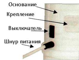
Рис. 3 - Основные элементы рециркулятора 1-115 М, 1-115 МТ, 1-130 М, 1-130 МТ, 2-115 М, 2-115 МТ, 2-130 М, 2-130 МТ, 1-115 П, 1-115 ПТ, 1-130 П, 1-130 ПТ, 2-115 П, 2-115 ПТ, 2-130 П, 2-130 ПТ