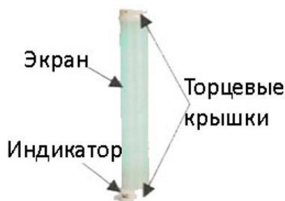
Рис. 1 - Основные элементы рециркулятора 1-115 П, 1-115 ПТ, 1-130 П, 1-130 ПТ

Основные элементы рециркуляторов представлены на рис. 1 - 3.