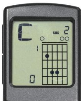
Режим последовательности аккордов